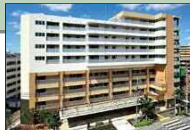
品川区立平塚橋特別養護老人ホーム