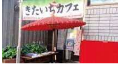
認知症カフェの一例

認知症の人と家族、区民の誰もが参加できる交流の場です。 開催場所、時間等については、「広報しながわ」を確認、もしくは高齢者福祉課（☎03-5742-6802）にお問合せください。